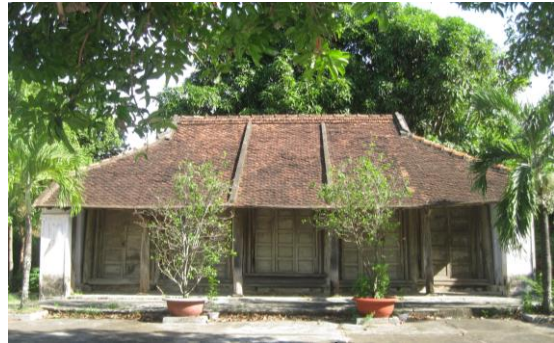
Lâm Phú Lâm.

Hoàng tôn thần, Bạch Mã tôn thần. Hiện trạng 6 sắc phong tại đình Ngọc Lãng được bảo quản tốt, nét chữ khá rõ, mặt sắc phong còn ánh lên nhũ bạc và hình rồng. Riêng sắc chỉ có niên đại năm Thiệu Trị thứ 4 (1844) bị hư hỏng, rách nhiều chỗ làm mất cả một đoạn văn bản gây khó khăn cho việc tra cứu nội dung của sắc chỉ.